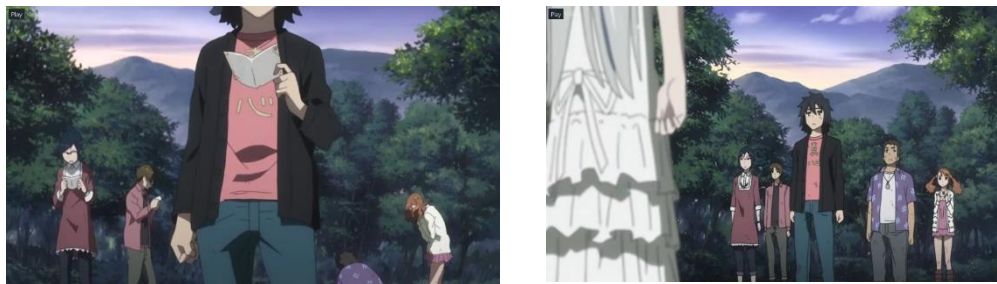
Gambar 8. Episode 11 di menit 19:18 – 19:52

“Aku mencintaimu Jintan, cintaku padamu adalah cinta yang singkat dimana aku ingin menikahimu” surat untuk jintan