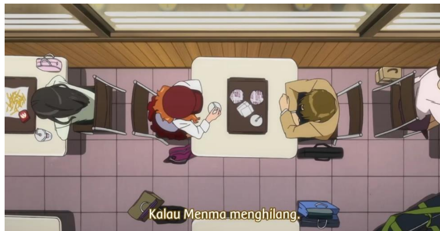
Gambar 9. Episode 10 di menit 05:46 – 06:20

Pada episode 10 di menit 05:46 – 06:20, di sana Anaru terlihat sedang bercerita bersama Yukiatsu. Disana Anaru menyampaikan sebuah perasaan jujurnya tentang keresahannya terhadap Menma. Dia menyampaikan kepada Yukiatsu bagaimana sendainya jika Menma menghilang, apakah itu akan membuatnya dekat dengan Jintan. Tapi ternyata pemikiran Anaru salah, ternyata ketika Menma benar benar menghilang pikiran bahwa dia dengan Jintan menjadi dekat itu tidak terjadi. Malah semakin membuat jarak diantaranya, Yukiatsu yang mendengar hal itu bisa memahami dan menerima pemikiran Anaru. Yukiatsu tidak mengejek atau mencela pemikiran dari Anaru.