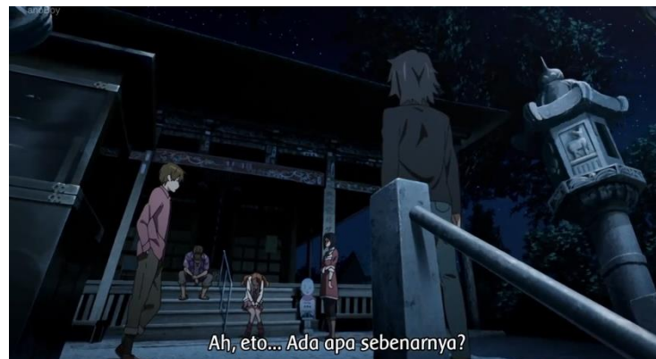
Gambar 10. Episode 11 pada menit 02:00 – 10:30

Meskipun ada sedikit pertengkaran yang terjadi akan tetapi mereka juga saling memberikan dukungan emosional yang saling menguatkan satu sama lainnya.