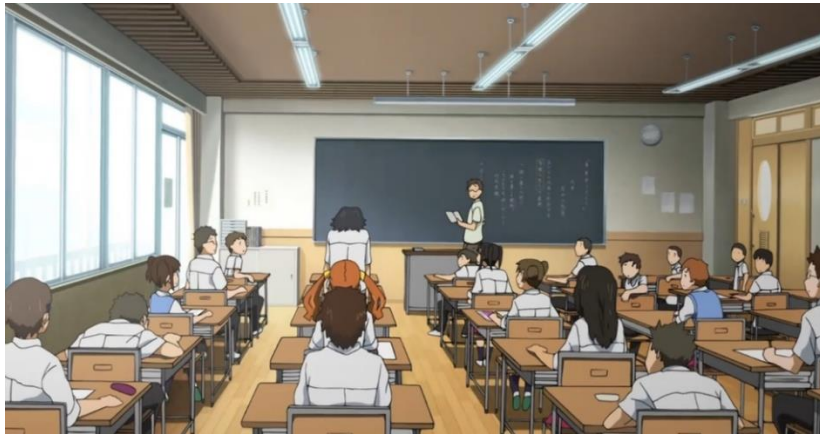
Gambar 6. Episode 6 di menit 06:36 – 08:43

Tanda : Jintan sedang berdiri dan berteriak di kelas untuk membela Anaru ditengah pelajaran.