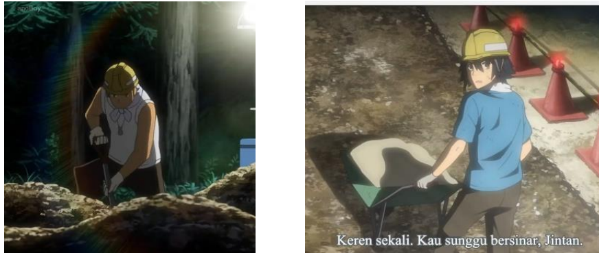
Gambar 3. Episode 03 di menit 18:00 – 19:00

Tanda : Poppo dan Jintan sedang bekerja dikonstruksi pembangunan jalan pada malam hari. Mereka bekerja sama untuk mengumpulkan uang demi bisa membuat kembang api raksasa