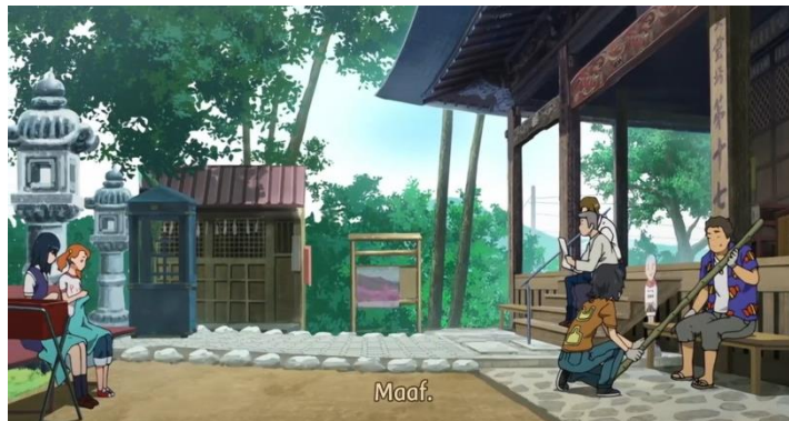
Gambar 1. Episode 09 di menit 10:58 – 11:29

Pada episode 09 di menit 10:58 – 11:29, disana Jintan dan sahabatnya sedang mempersiapkan bahan bahan yang nantinya akan digunakan untuk membuat kembang api raksasa. Disana terlihat mereka sedang bekerja sama dengan membagi pekerjaannya seperti Jintan dan Poppo yang mengurus bagian bambu. Anaru dan Tsuruko yang sedang mengurus masalah kain. Yukiatsu membantu perancangan kembang api bersama seorang paman yang ahli dalam membuat kembang api besar.