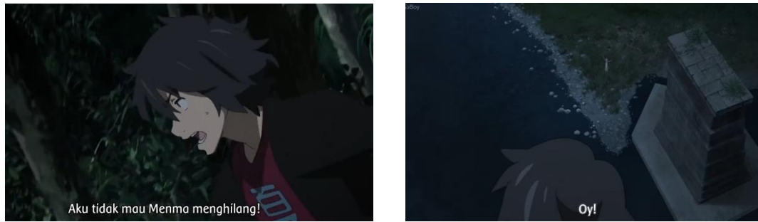
Gambar 7. Episode 6 di menit 18:27 – 20:00

Tanda : Jintan yang berlari untuk turun kebawah setelah melihat Menma berada di pinggiran sungai yang terletak di bawah jembatan.