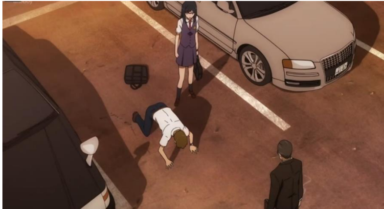
Gambar 4. Episode 09 di menit 07:30 – 08:03

istrinya. Yukiatsu yang tidak kenal menyerah terus memohon bahkan sampai sujud untuk meminta izin restu untuk membuat kembang api raksasa.