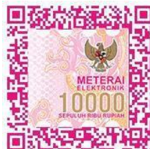
(Lusiana Dwi Saputri)