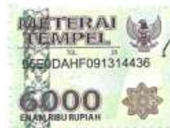
(Dwi Rahma Yuniasih)

Surakarta, September, 2019 Yang membuat pernyataan,