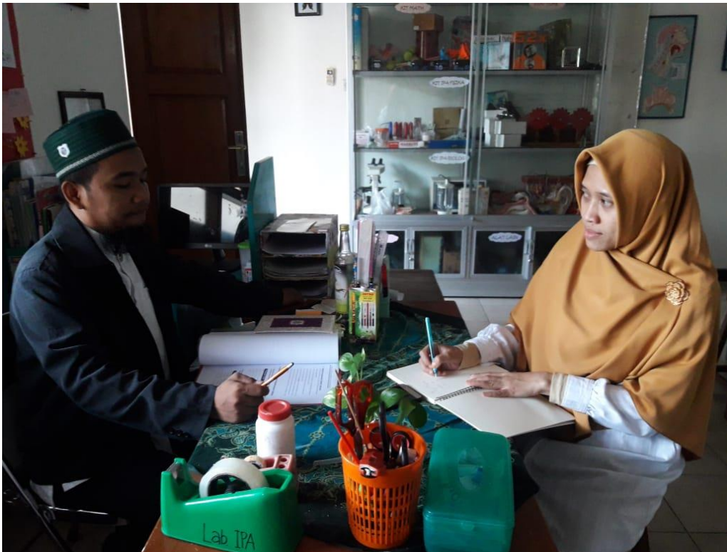
Wawancara dengan Koordinator Kelas Unggulan Program Tahfidz