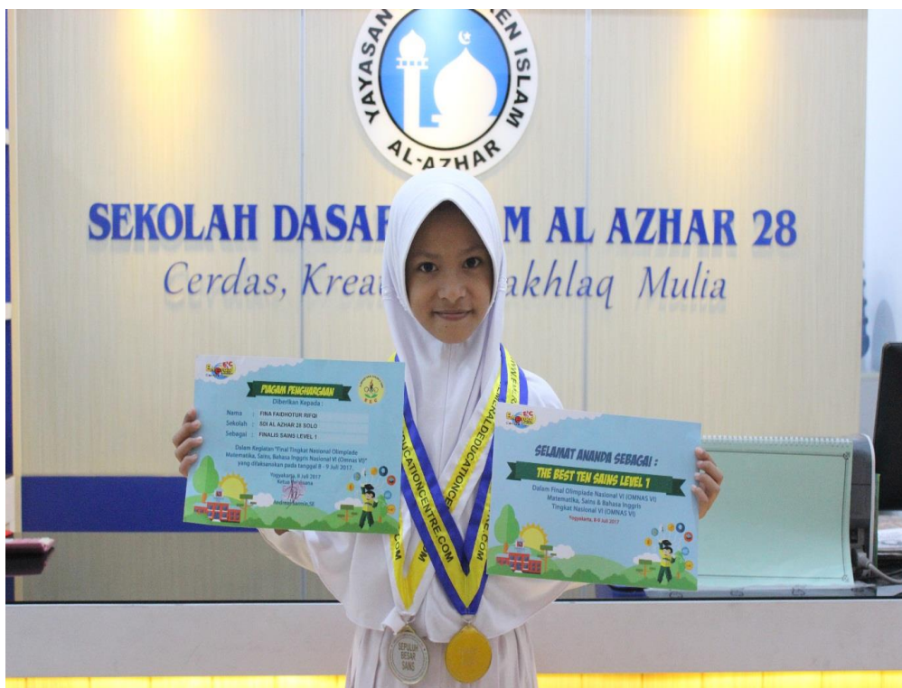
Salah satu murid berprestasi dari kelas tahfidz