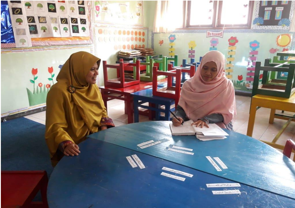
Wawancara dengan Guru Kelas di Kelas Unggulan Program Tahfidz