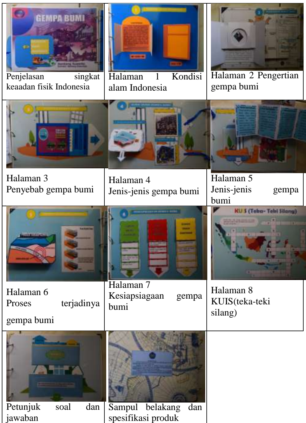
Gambar 3. Hasil Media Scrapbook Pembelajaran Gempa Bumi