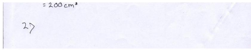
Gambar 1 Hasil Pekerjaan M1

Jawaban siswa pada soal no 2 dapat dilihat pada gambar 1