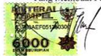
Agung Adi Nugroho