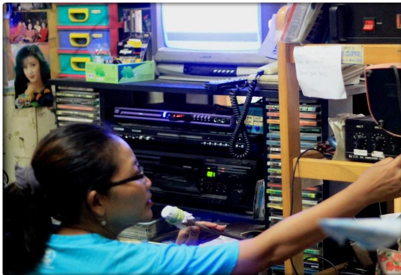
Gambar 1.6 Studio Siaran Audio Station In House

untuk bersiaran, tidak mengurangi antusias pendengar ( audience ) di Pasar Klewer untuk selalu mendengarkan siarannya. Selain itu hal ini juga disebabkan pendengar ( audience ) di Pasar Klewer memang sengaja dipaksa untuk mendengarkan, karena dalam hal ini sebagai media penyampai informasi kepada komunitas pedagang di Pasar Klewer radio ini menggunakan sarana kabel dan speaker-speaker yang dipasang di atas atap-atap komunitas pedagang, sehingga seluruh kendali suara ada pada studio siara, bukan pada audience di Pasar Klewer.