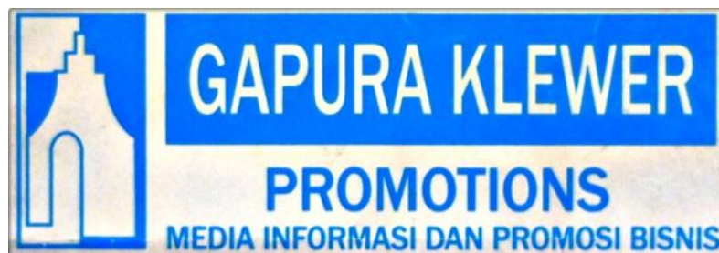
Gambar 1.8 Logo Perusahaan