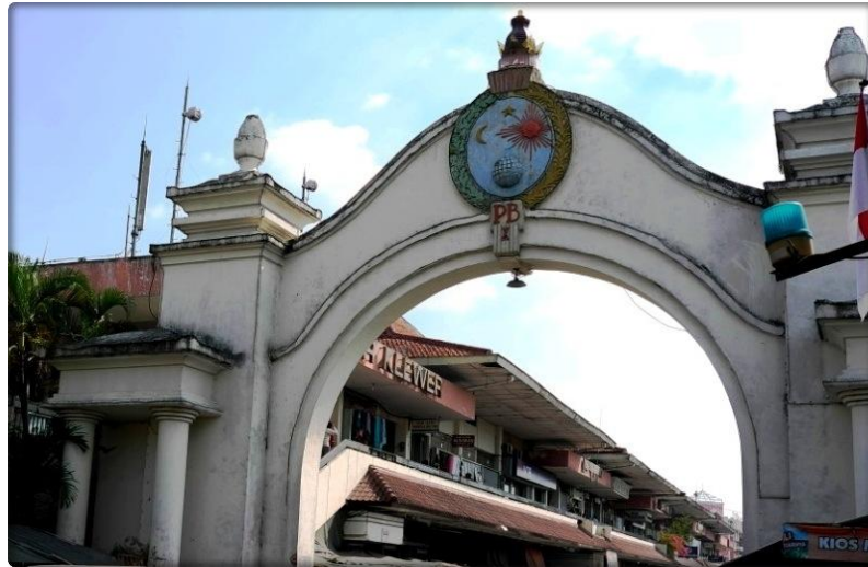
Gambar 1.7 Pasar Klewer