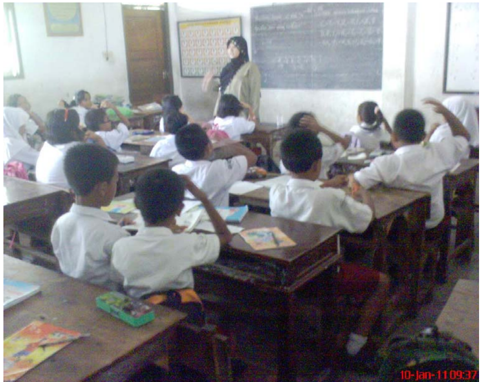
Siswa Mengujarkan Diikuti dengan Gerakan